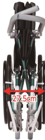
折りたたためコンパクト