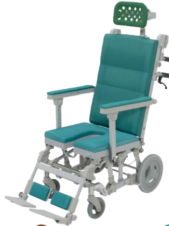
U型/ヘッドレストF付 品番:SRC-006