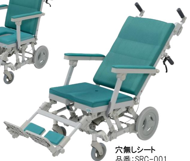
穴無しシート 品番:SRC-001