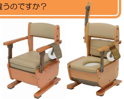
さわやかチェアPT さわやかチェア泉Ⅱ

違いとして泉Ⅱは座面角度が調整できます。PTと比べ丸みのあるデザインが特徴です。また、泉ⅡはPTと比べ脚部を外側に出しているため横からの荷重に強いです。