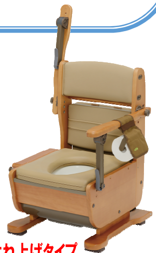
肘掛けはね上げタイプ

ウチエ全商品のデモ機がございます。お貸出は1週間~10日程でお願いしております。 衛生面から実使用は出来ませんがご希望がありましたら発送させていただきます！