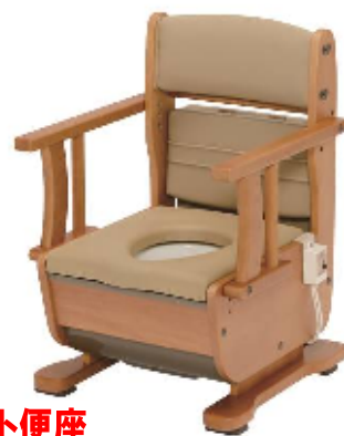
ホット便座 肘掛け自在タイプ

材質：本体/天然木 便座/ポリウレタン、ABS 重量：約 17.5kg (ホット便座：約 18.5kg)