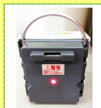
6 1分間放電 ガラス管についた水気を飛ばします