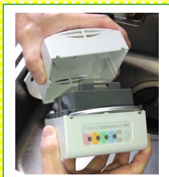
1 カバーを外します。

準備する物： やわらかい毛のブラシ類（ガラス管の掃除に使用。） 水分をふき取るためのタオル