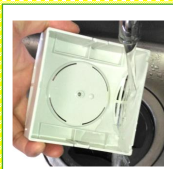
4 カバーの通気口も水洗いします