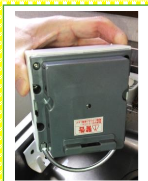
2 把手を下に向けます