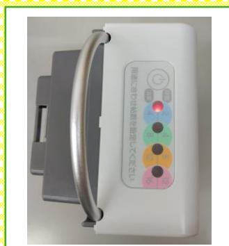
5 水気をふき取り電源ボタンを3秒長押しをし、放電します