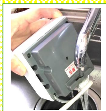
3 ガラス管を流水で流しながらブラシをかけます