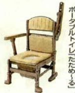
ポータブルトイレ「たためる」