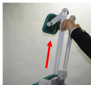
ヘッドレスト取り外し

サイズ:幅 53×奥行 105(110)[155]×高さ 121.5[77.5]cm 前座高 46.5(乗車時)[54]cm、座幅(肘～肘)42.5cm リクライニング角度 97～165° ※( )転倒防止バー長、※[ ]最大リクライニング時 材質:アルミニウム合金、アルミダイカスト成型品、ステンレス 合成樹脂成型品、EVA、ポリアミド、天然ゴム 他