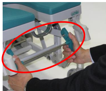
フットレスト連動解除