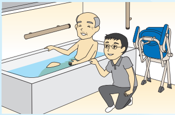
介助スペースがゆったりとれます。