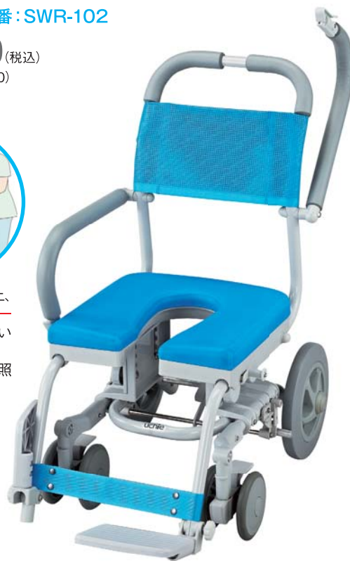
セーフティタイプ

肘掛けが前倒れ防止、 座位保持に使えるセーフティタイプもご ざいます。 ※詳しくはP.27参照