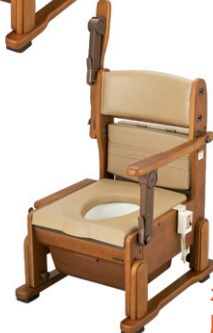
ホット便座 肘掛けはね上げタイプ 品番:8243