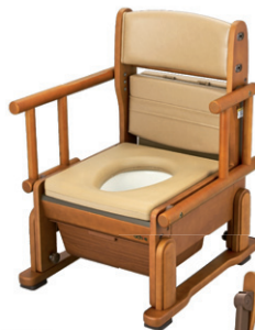
肘掛け自在タイプ 品番:8240