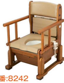
ホット便座 肘掛け自在タイプ 品番:8242