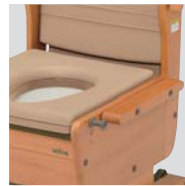
肘掛けはね上げタイプ

ベッドとのすきまを埋め、移乗をサポートします。 スペーサーは左右付け替え可能です。 (肘掛けはね上げタイプのみ:1本標準装備)