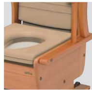
肘掛け自在タイプ