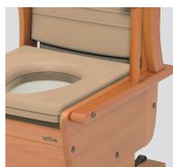
肘掛け自在タイプ