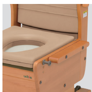
肘掛けはね上げタイプ

ベッドとのすきまを埋め、移乗をサポートします。スペーサーは左右付け替え可能です。(肘掛けはね上げタイプのみ:1本標準装備)