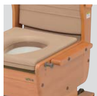
肘掛けはね上げタイプ

ベッドとのすきまを埋め、移乗をサポートします。スペーサーは左右付け替え可能です。(肘掛けはね上げタイプのみ:1本標準装備)