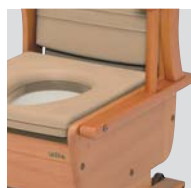
肘掛け自在タイプ